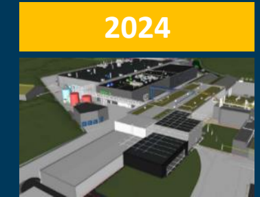
Innovationszentrum Bergen op Zoom