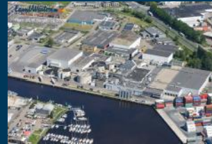
Werk Bergen op Zoom